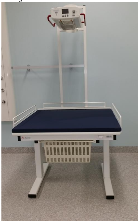
Beta Care skötbord (här med skötbordsvärmare Ceramotherm WY 3115)