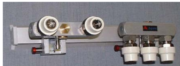
Förgreningssuttag för O2 och A-Luft