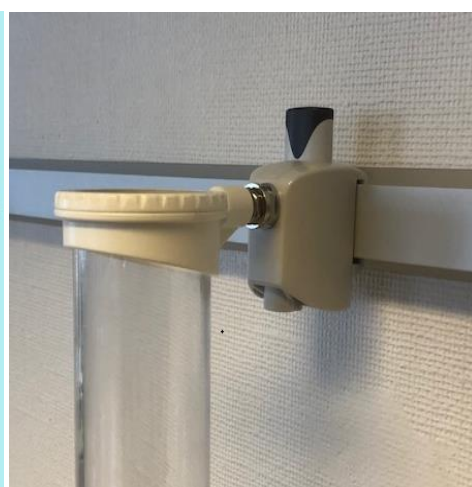
Kogerhållare med klove för IVA-skena Kogerhållare universal för EU / IVA-skena