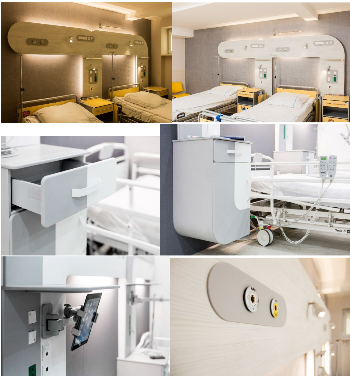
MeryComfort Integrerad belysning, Smarta lådsystem, hållare för surfplattor, gasuttag svensk standard

Vi är säkra på att vi kan ge er en intressant vårdrumspanel!