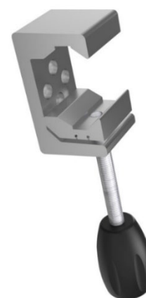
3. Universalklove EU/IVA & rundstång Ø18mm-40mm