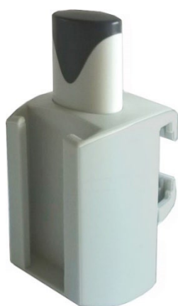
1. Universalklove EU/IVA

Vi marknadsför klovar i olika utförande vilka passar till ett flertal medicintekniska utrustningar avsedda att monteras på sjukhusets medicintekniska skenor. Klovarna finns i utförande universal, vilka passar både EU-skena 25x10 och IVA-skena 30x10 samt standardklove för 30-10 IVA-skena alternativt 25x10 EU-skena